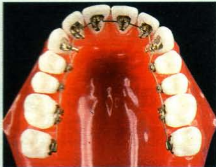
Lingualtechnik: Die Metallspange sitzt an der Innenseite der Zähne

Invisalign: Aus den USA kommen herausnehmbare Zahnschienen aus transparentem Kunststoff namens Invisalign. Nach einer Planung mit Hilfe von Videoaufzeichnungen, Röntgenbildern und Kieferabdrücken werden sie individuell angefertigt. Sie müssen 23 Stunden pro Tag getragen werden. Im Laufe der Behandlung werden immer wieder neue, angepasste Schienen hergestellt, insgesamt bis zu 40. Kosten: 7 000 bis 9 000 Euro.