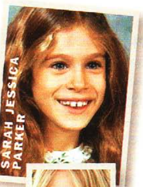
SARAH JESSICA PARKER